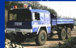
Baujahr 1978 (36 Jahre)